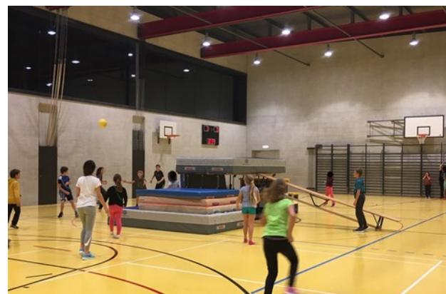
Activité « burner Games »