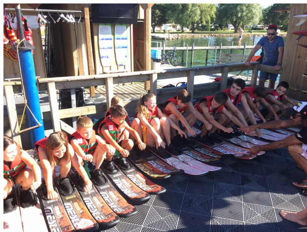
Activité « ski nautique »