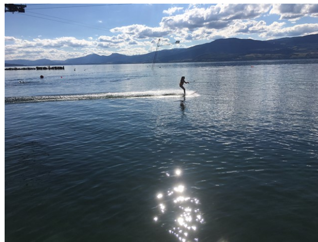
Activité « ski nautique »